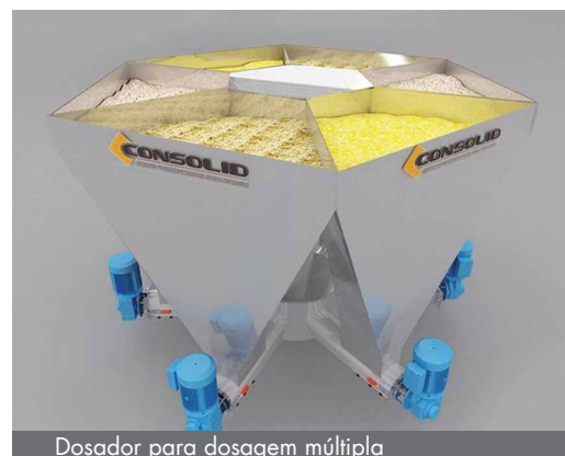
Dosador para dosagem múltipla