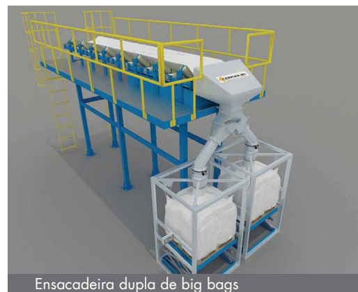
Ensaadeira dupla de big bags