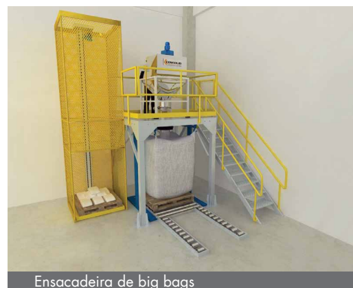
Ensaadeira de big bags