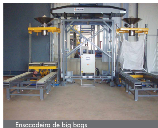
Ensaadeira de big bags