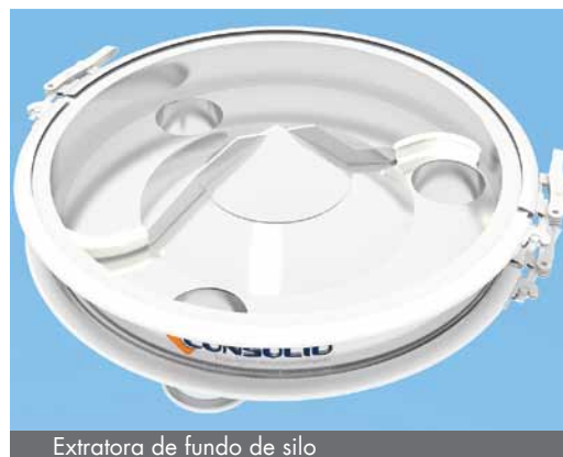
Extratora de fundo de silo

Confeccionados aço carbono ou aço inox 304L/316L; Lâmina dos raspadores feita de aço carbono ou aço inoxidável; Raspadores feitos de SINTEX ou UHMW;