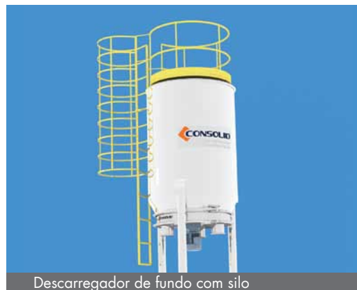
Descarregador de fundo com silo