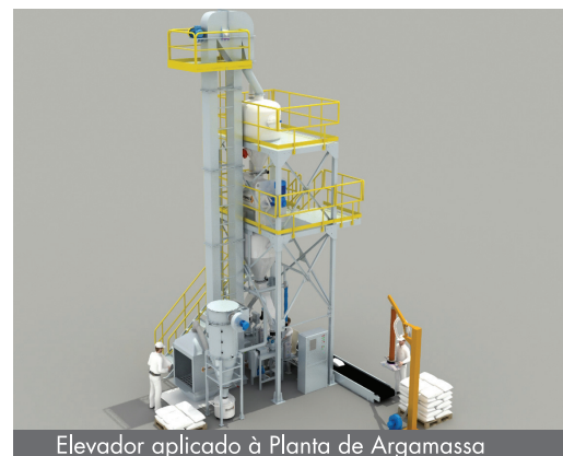
Elevador aplicado à Planta de Argamassa