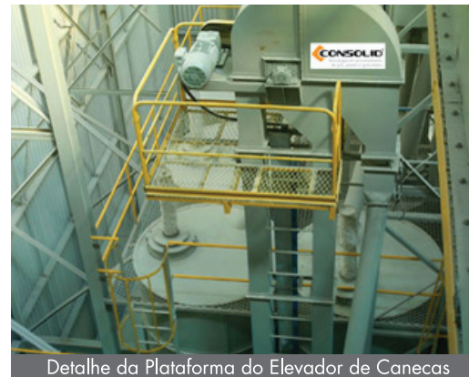
Detalhe da Plataforma do Elevador de Canecas