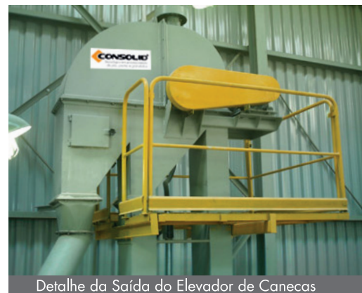
Detalhe da Saída do Elevador de Canecas