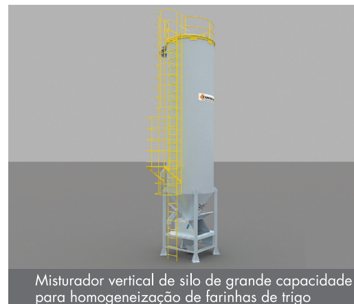
Misturador vertical de silo de grande capacidade para homogeneização de farinhas de trigo