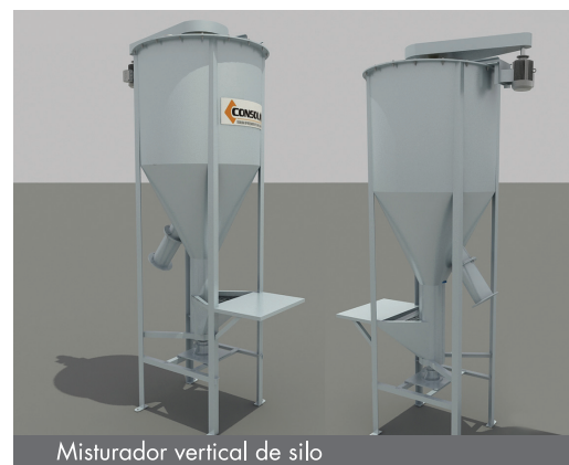
Misturador vertical de silo