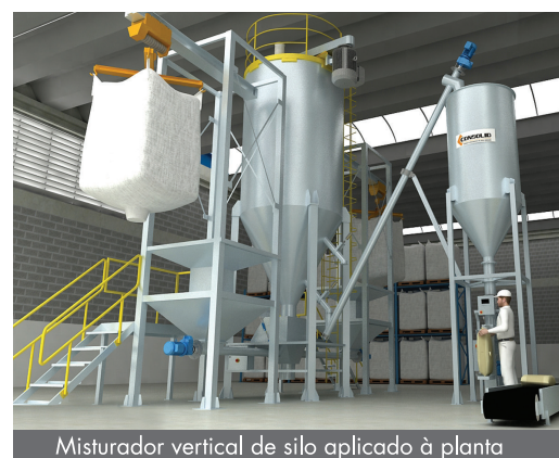
Misturador vertical de silo aplicado à planta