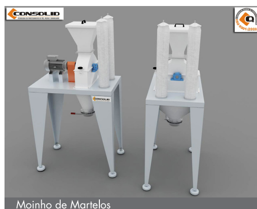
Moinho de Martelos

CONSOLID ® Tecnologia em processamento de pós, pastas e granulados