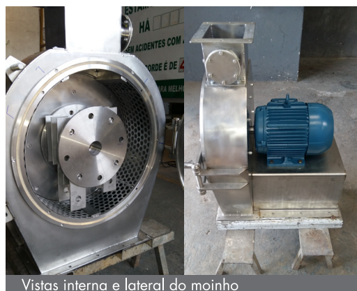
Vistas interna e lateral do moinho