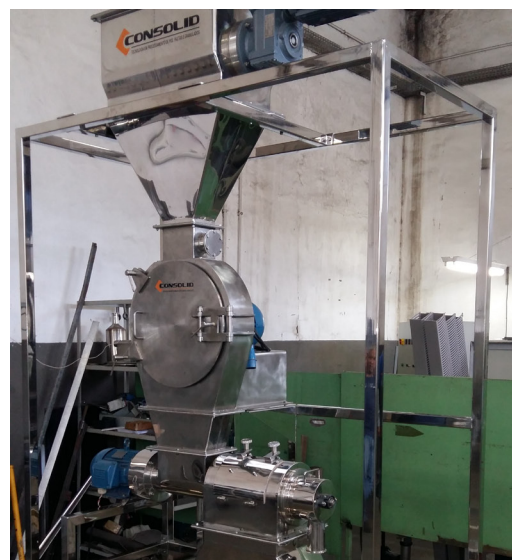
Moinho aplicado na planta de polpa de fruta