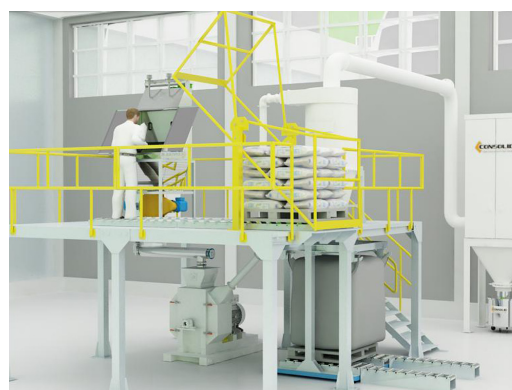
Planta de Moagem e Ensaque de Big Bags