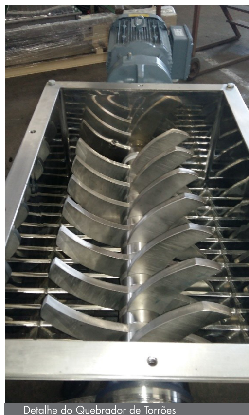
Detalhe do Quebrador de Torrões

CONSOLID ® Tecnologia em processamento de pós, pastas e granulados