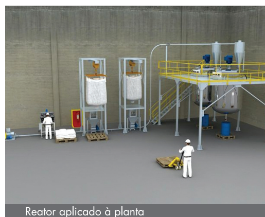
Reator aplicado à planta