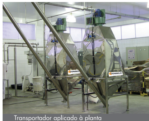
Transportador aplicado à planta