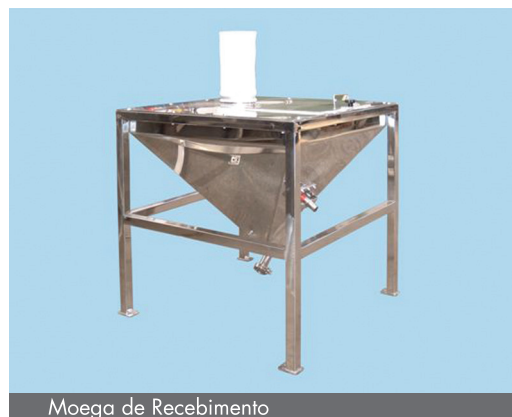
Moega de Recebimento

CONSOLID ® Tecnologia em processamento de pós, pastas e granulados